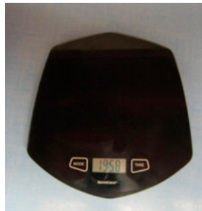
Balance de cuisine

Les balances à plateaux se lèvent et se baissent. Il faut équilibrer les plateaux avec des masses marquées en grammes pour peser un objet.