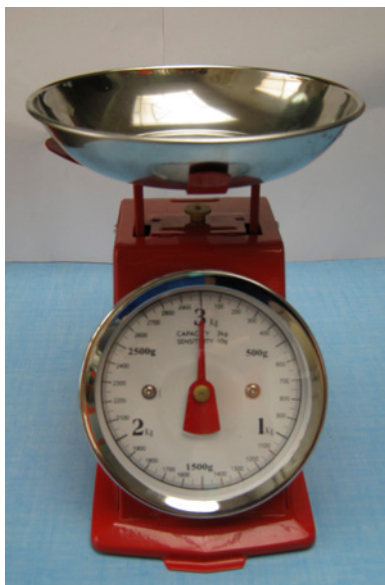
Balance de cuisine

Le nombre s'affiche une fois l'objet posé.